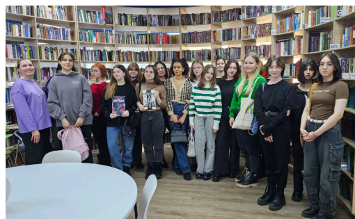
10-ые классы на экскурсии в библиотеке

На февральских каникулах тоже проводили время активно - 10 "А" и "Э" медиаклассы побывали в SMART-библиотеке имени Анны Ахматовой .